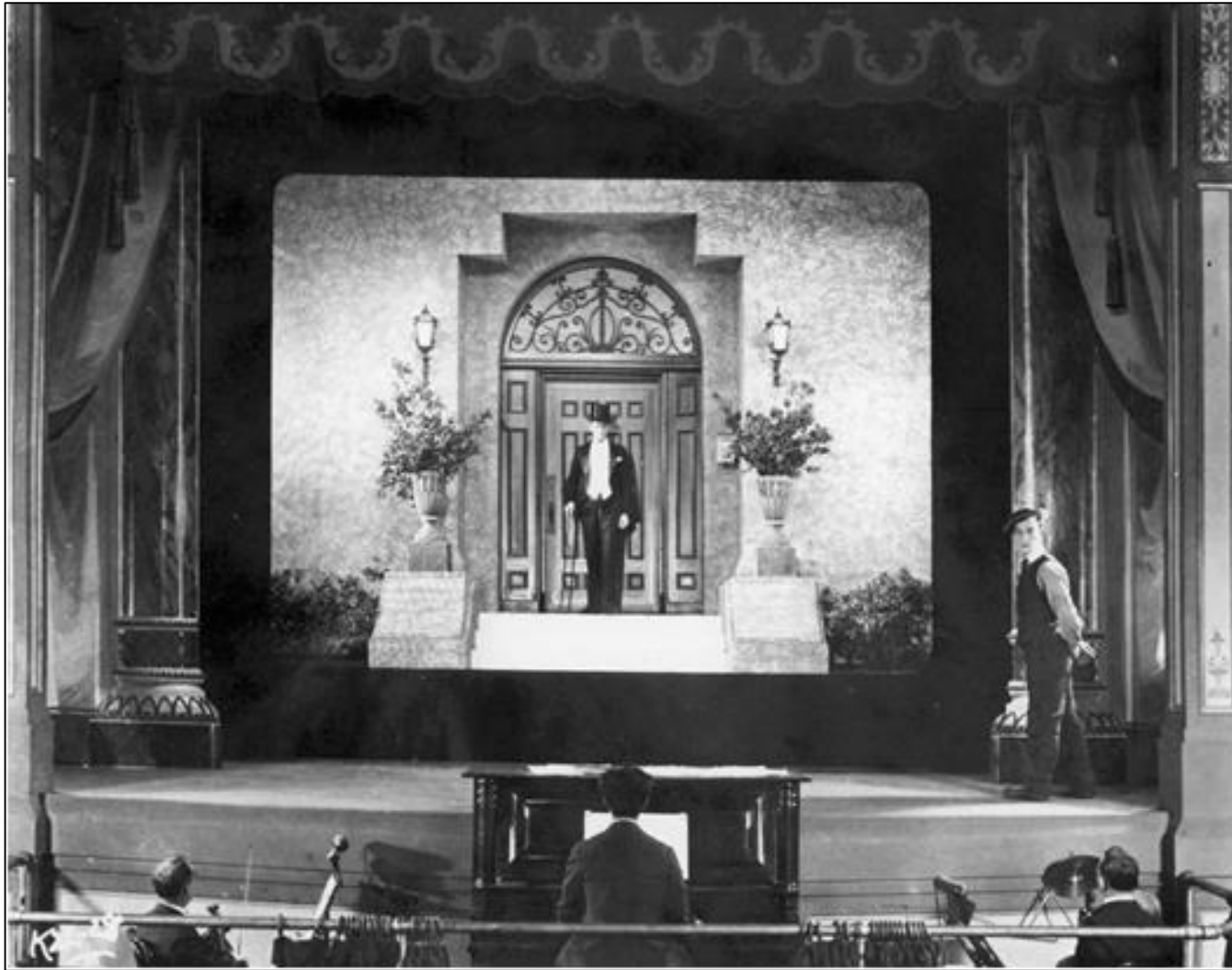
Buster Keaton: Az ifjú Sherlock Holmes (1924) című filmjének mozi jelenete a mozizongoristával